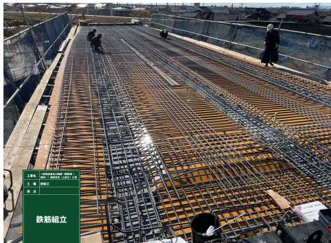
型枠の上に鉄筋を配置