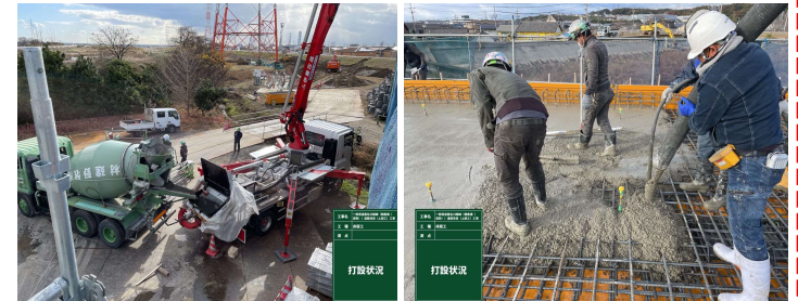
床版コンクリート打設