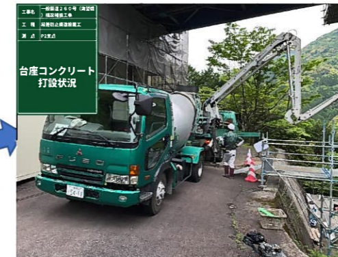
P2支点：林道より打設