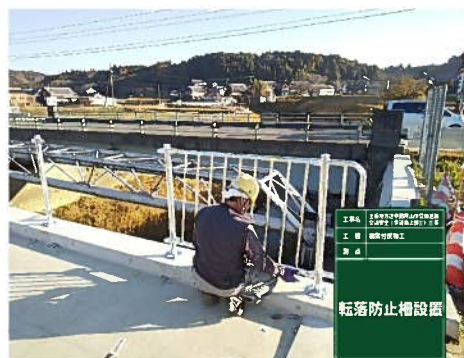
防護柵の取付・設置