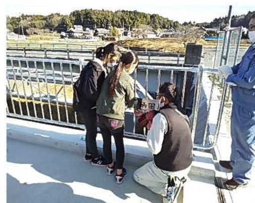
橋名板の取付（取付式を開催）

*：阿山小学校 総務委員会のみなさんにデザインしていただいた橋名板 作成してくれた皆さんに取り付けてもらいました。