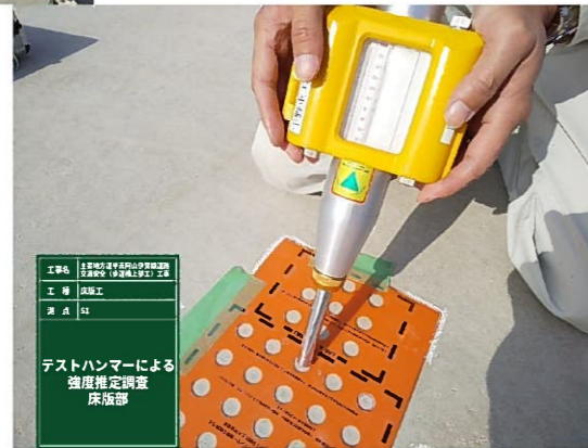
テストハンマによる強度確認